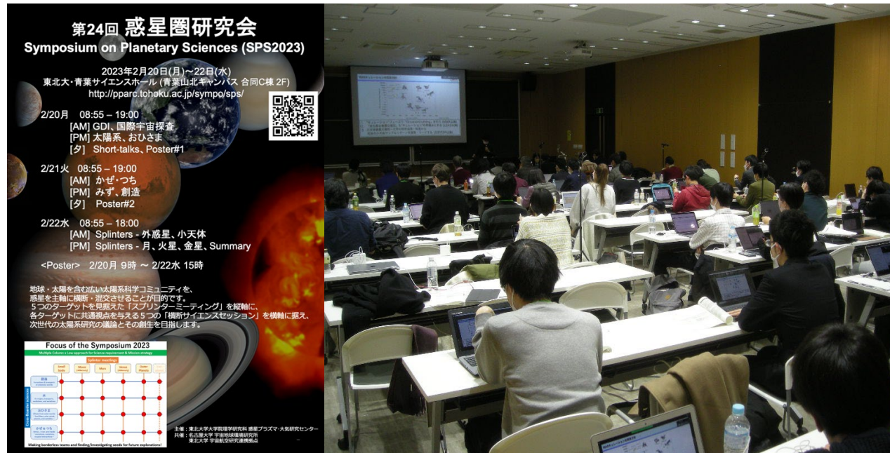
図3. 惑星圏シンポジウム (2023/2/20-22)

(2) 研究集会：惑星圏シンポジウム ( https://pparc.tohoku.ac.jp/sympo/sps/ 、2023年2月20日(月)～22日(水)) において、「実会場(理学研究科)を伴うハイブリッド方式」で150名程度の参加を得て、東北大も参加貢献する太陽系全域の科学探査と将来有人活動を目指す「国際宇宙探査」に絡む戦略的な議論を行った。「春」に行うこの会合は、「秋」に行うJAXA相模原での会合で受ける「年2回方式」の一環であり、今後の日本の太陽系開拓の道へ連なる戦略的議論の場となっている。(図3) また、産学連携を含む戦略的な教育Programの構築にも取り組みつつあり、名大で9月・3月に行われている超小型衛星教育プログラム「民間における宇宙利用 基礎コース・発展コース」へ本学大学院生を派遣( https://coso.isee.nagoya-u.ac.jp/sero/course_2302.html )するとともに、この「全国化」検討を主軸とした議論を東大・名大・総研大とともにJAXA・文科省を含め議論中である。2024年春に宇宙航空科学技術推進委託費 ( https://www.mext.go.jp/a_menu/kaihatu/space/jigyuu/detail/1347482.htm ) への応募を予定。