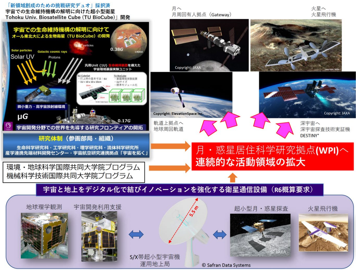
図1.関係する提案活動

この組織化と共同インフラ構築のため、施設概算要求の申請（超小型衛星運用アンテナの更新）を進めるとともに、「宇宙航空連携研究センター」概算要求検討およびWPI学内申請を行った(図1)。